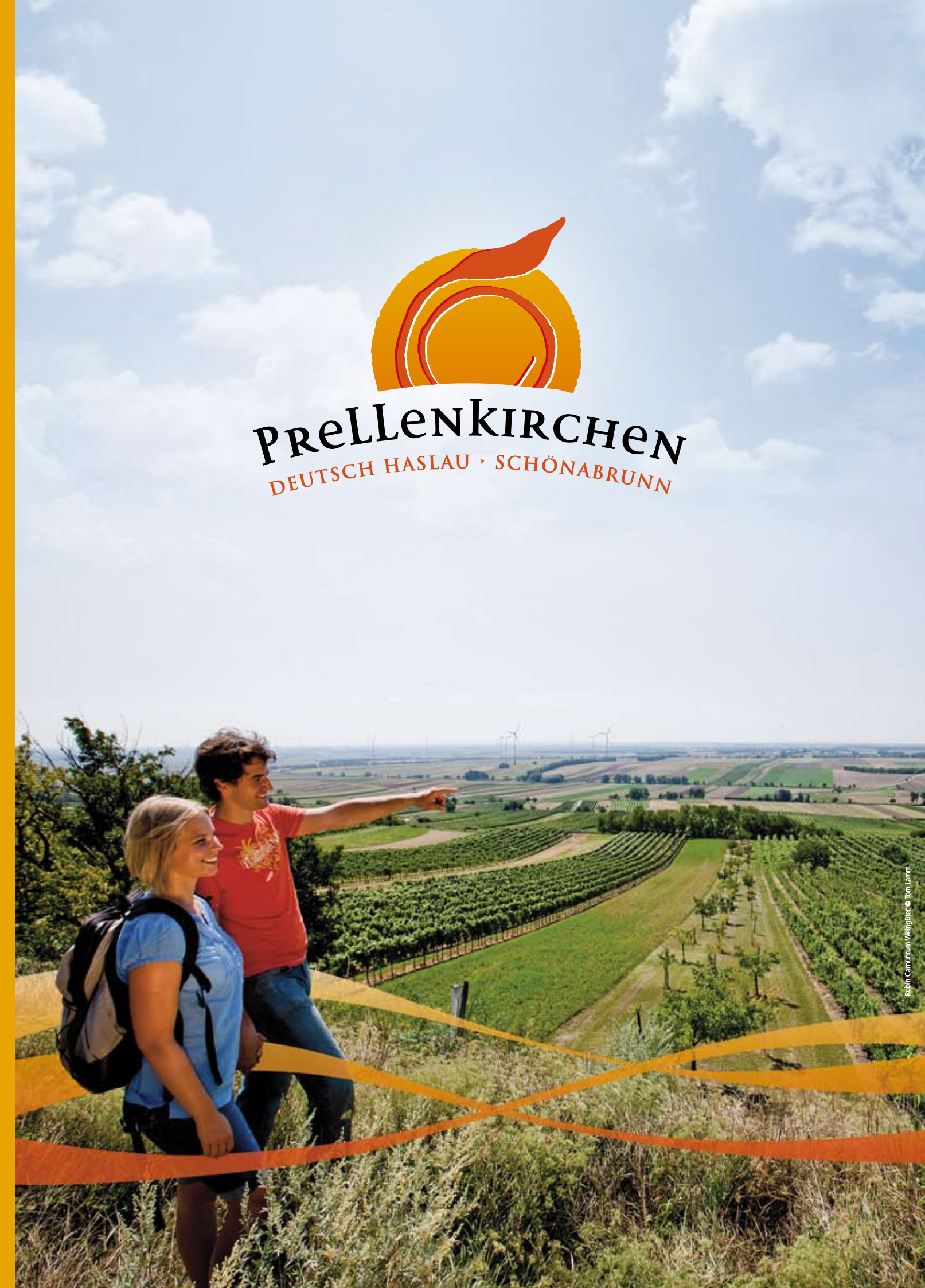
Rubin Carnuntum Weingüter

PreLLenKirchen DEUTSCH HASLAU · SCHÖNABRUNN