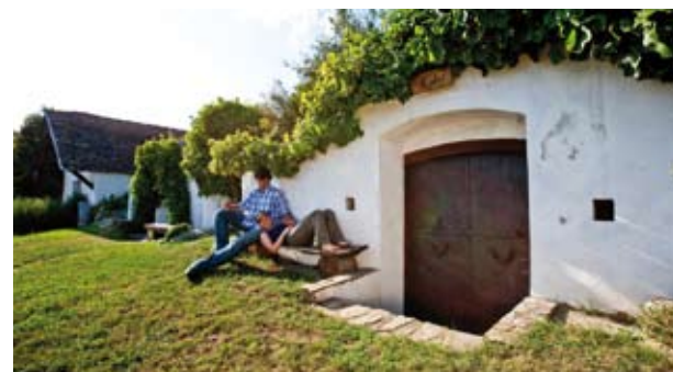
Rubin Carnuntum Weingüter

Egal, ob in Schönabrunn, Deutsch-Haslau oder Prellenkirchen - Unsere Gemeinde bietet vielseitige Lebensqualität. Aus dem Zusammenhalt einer engagierten Gemeinschaft entsteht hier voller Elan immerzu Neues und wird Bewährtes in allen Bereichen des Lebens erhalten: von Wirtschaft, Bewegung über Wohnen, Kultur bis hin zur Umwelt. Außergewöhnliches Engagement liefert wertvolle Energie für unseren „Aufwind“.