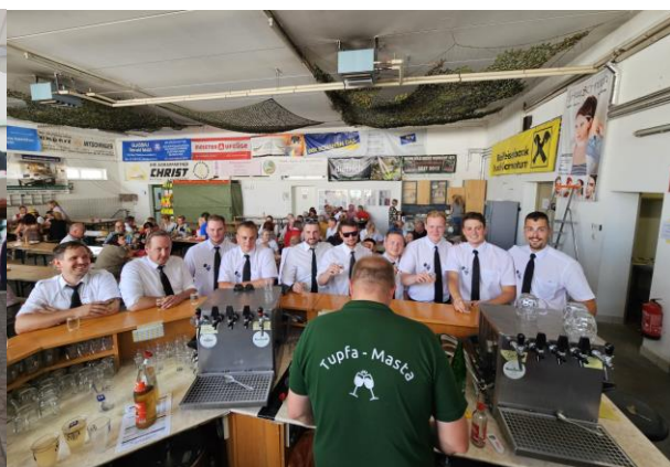
Feuerwehrfest der FF Prellenkirchen