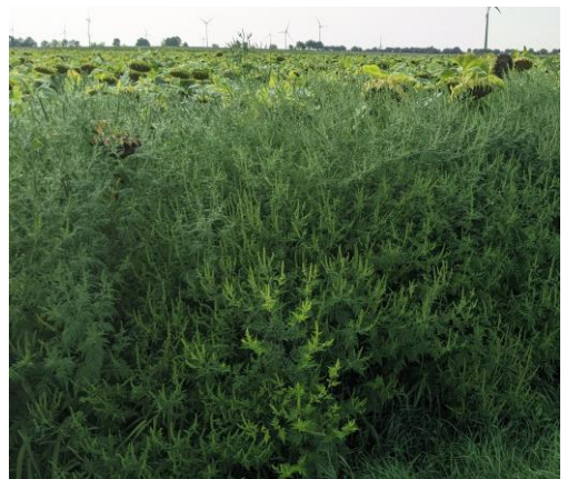
Ragweed mit Blütenständen vor Sonnenblumenfeld im August