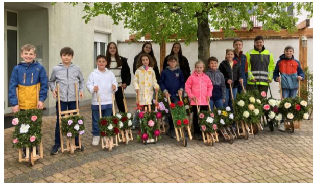
Unseren Ratschenkindern – einen herzlichen Dank