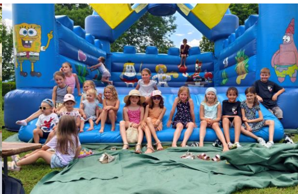
Sommerfest der FF Schönabrunn