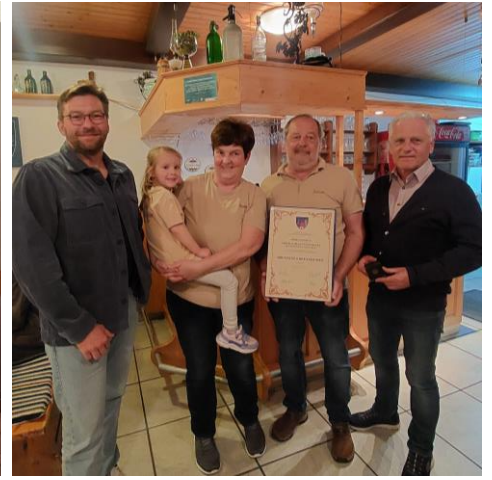
Buschenschank Mölk Bronzenes Ehrenzeichen