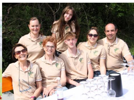
Jungweinwanderung am Spitzerberg