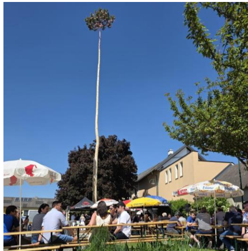
Maibaumstellen in unseren Ortschaften