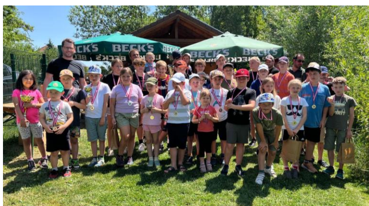
Tontaubenschießen der JG Deutsch Haslau