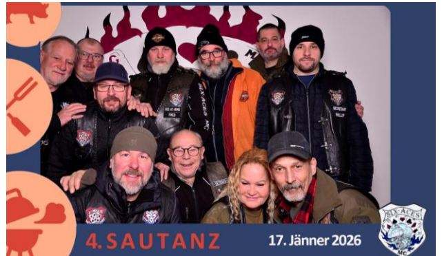
Sautanz der Six Aces