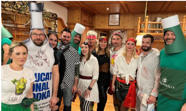
Sportlermaskenball im GH Hoffmann