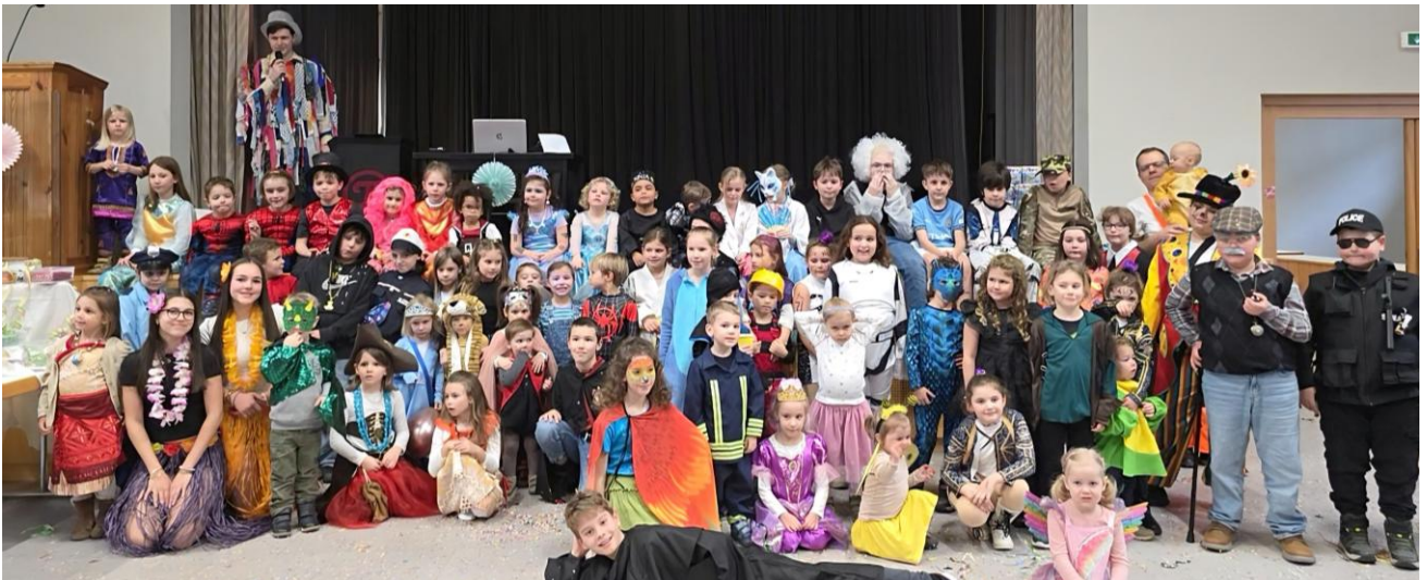
Kindermaskenball vom Musikverein