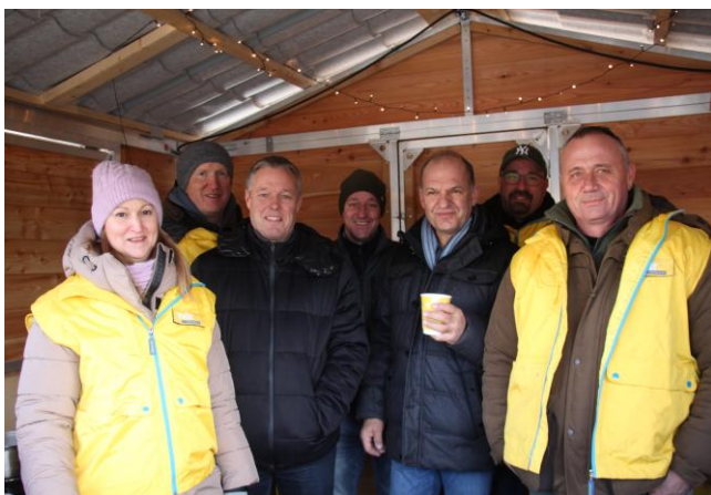
Silvesterpunsch der ÖVP Prellenkirchen