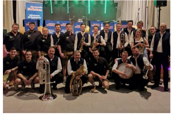
„Aufgebrast - BlechRevolution im Kulturhaus