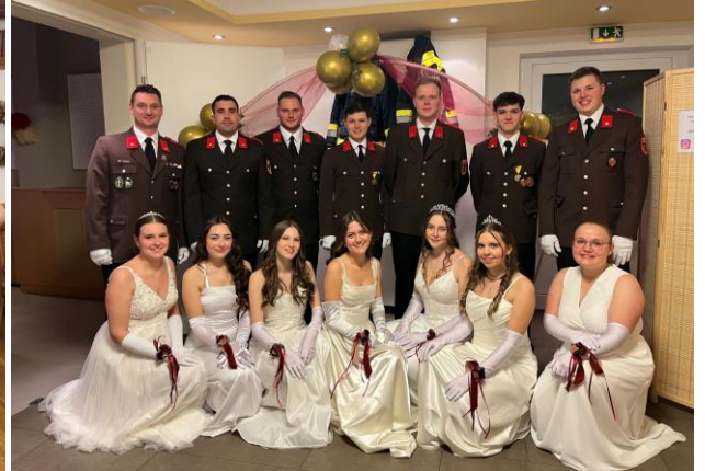
Ball der FF Prellenkirchen