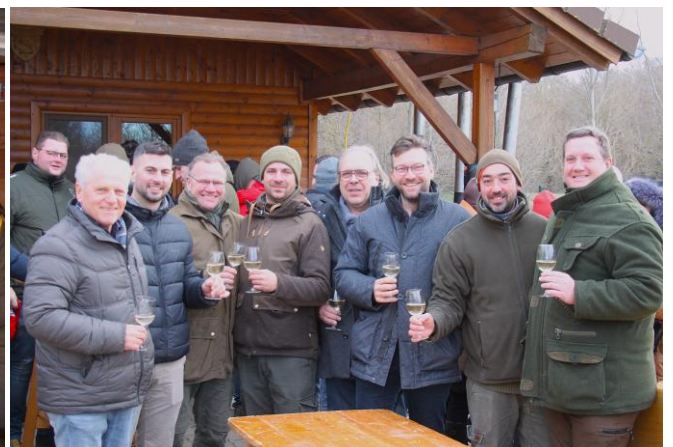
Kesselfleischessen vom Fischereiverein