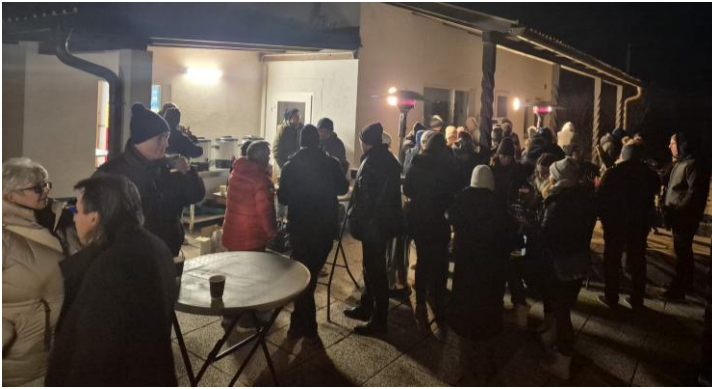
Punschstand vom TC Prellenkirchen