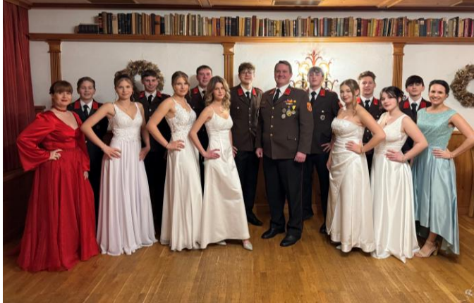
Ball der FF Deutsch Haslau