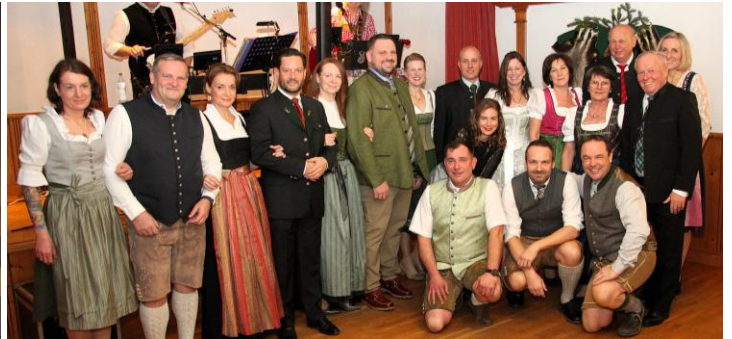
Jägerball der JG Deutsch Haslau